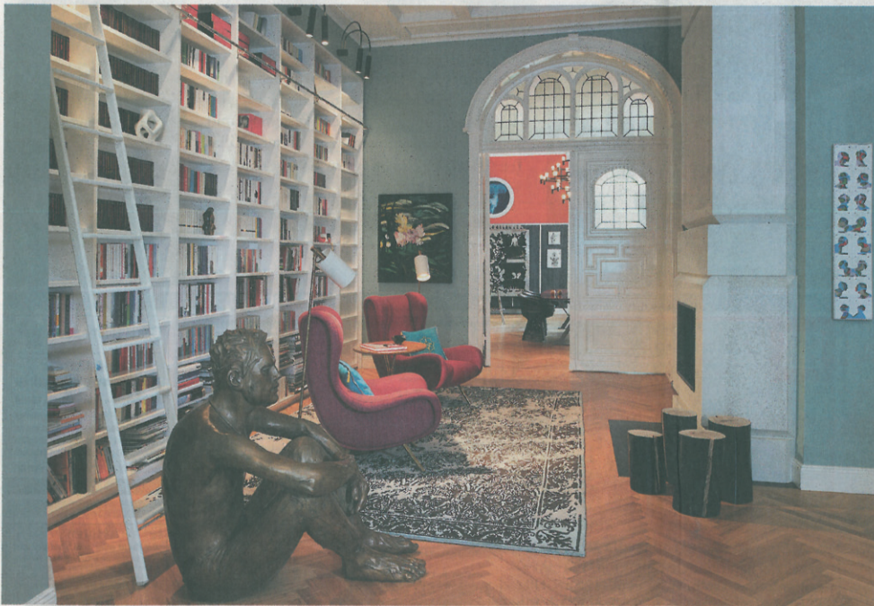
Schwereriges Blau: Doch Bücherwand, Kamin, Obrenessel und der Dauergast aus Bronze nehmen dem Ton die Kübel.