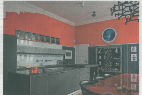
Blick in die Küche: Wenn schon radikal, dann auch konsequent.