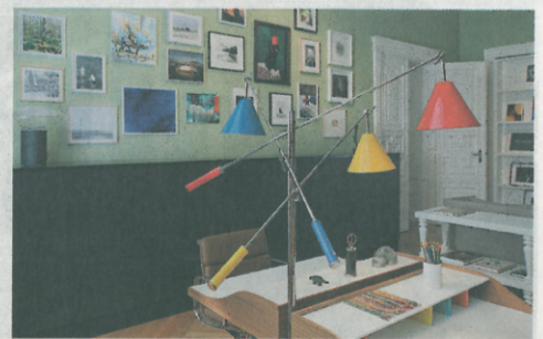
Das Arbeitszimmer: verspielt statt streng