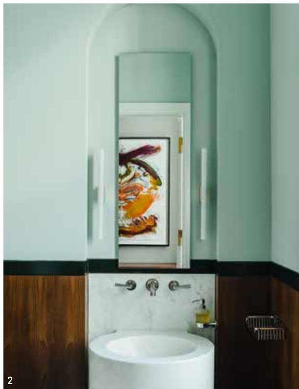
本页 1 定制化妆台，位于开放式卧房与浴室中间，为女主人带来更方便、讲究的装扮体验。2 客用浴室的墙面有着特别的弧度，被昵称为“小小的修道院”，镜子里映出的是Walter Stöhrer的作品。3 客卧里，Cassina小边桌与Tobias Grau壁灯带来了一点儿工业感。 对页 主人的浴室是整个公寓里装修工程最浩大之处，从无到有重新安装水管与暖气，用西西里岛黑色火山石制成的洗手台，Gisbert Poepler定制的圆形地毯都让这个私密空间特别抢眼。