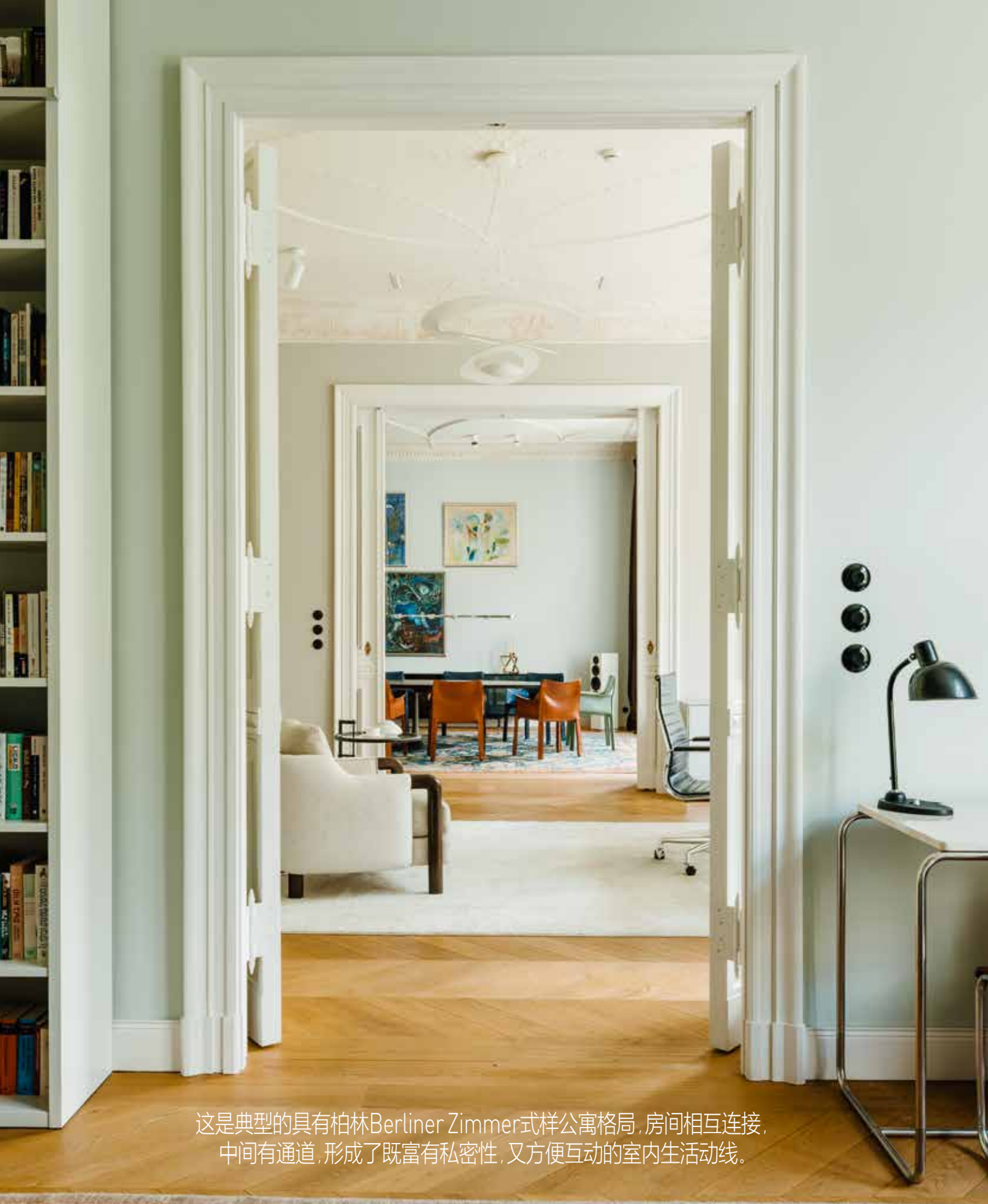
这是典型的具有柏林Berliner Zimmer式样公寓格局，房间相互连接，中间有通道，形成了既富有私密性，又方便互动的室内生活动线。