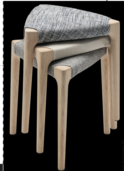
STATISTEN Stoffbezogene Hocker »Ticino Stool«, stapelbar. livingdivani.it