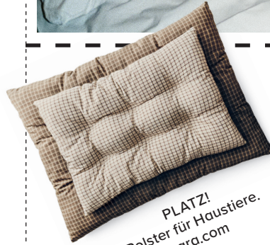
PLATZ! Polster für Haustiere. zara.com

Seit mindestens 15 000 Jahren stecken Hund und Mensch schon unter einer Decke, sagt die Forschung.