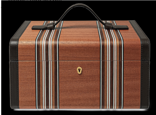
TRUHE IN FRIEDEN Uhrenbox »Intarsia« aus Holz mit Leder und Stoffbortenoptik. loropiana.com