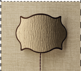
GEMISCHTES DOPPEL Stofftapete »Borneo« plus Wandleuchte bezogen mit Satinstoff Ripple_rubelli.com