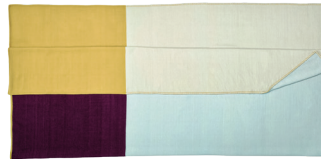
SCHÖNHALTUNG Bettüberwurf »Dadi« aus Kaschmir. gisbertpoepler.com