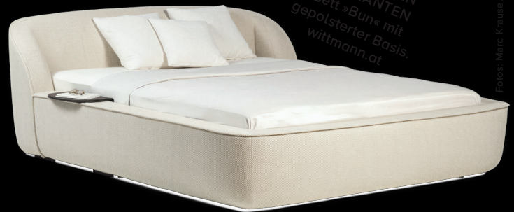
OHNE ECKEN UND KANTEN Bett »Bun« mit gepolsterter Basis. wittmann.at