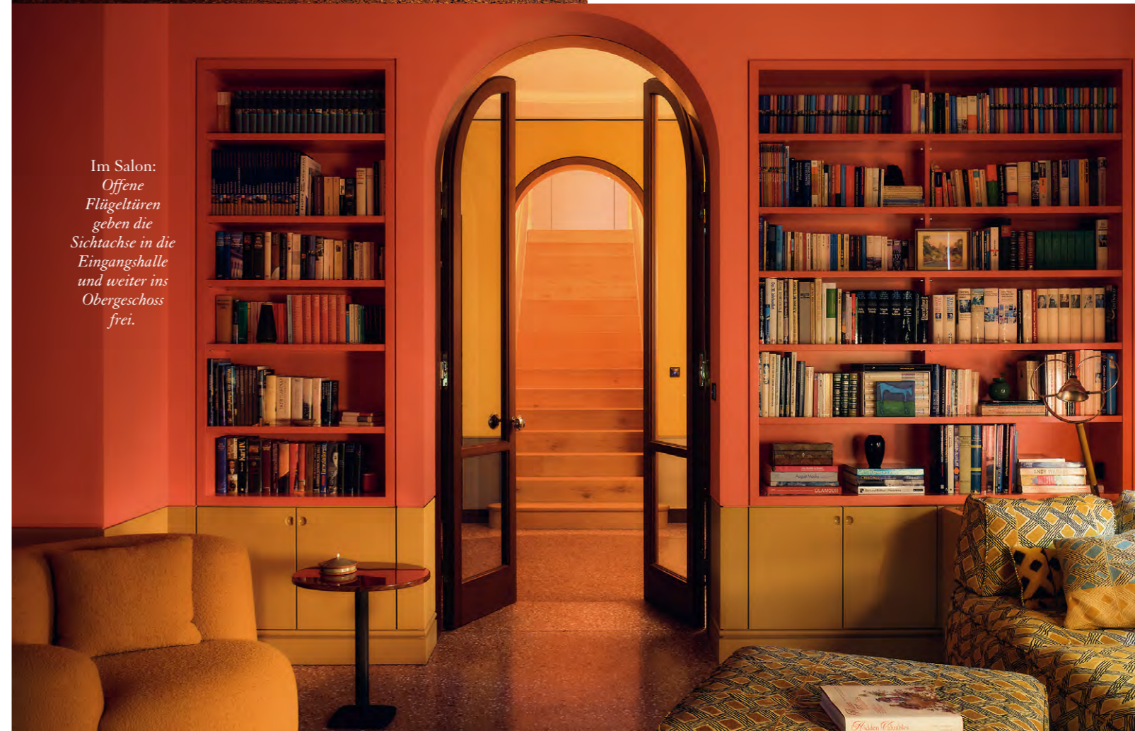
Im Salon: Offene Flügeltüren geben die Sichtachse in die Eingangshalle und weiter ins Obergeschoss frei.

Die Liebe zum Detail, mit der die Neugestaltung des Hauses geplant und umgesetzt wurde, spiegelt sich an vielen Orten wider. «Zusammen mit einem wunderbaren Spezialisten aus Berlin haben wir den Terrazzoboden mit lilafarbenen Akzenten entwickelt. Der Wandsockel in den Räumen im Erdgeschoss wurde mit einer senfgelb gestrichenen Holzpaneele strukturiert. Das hat mehrere