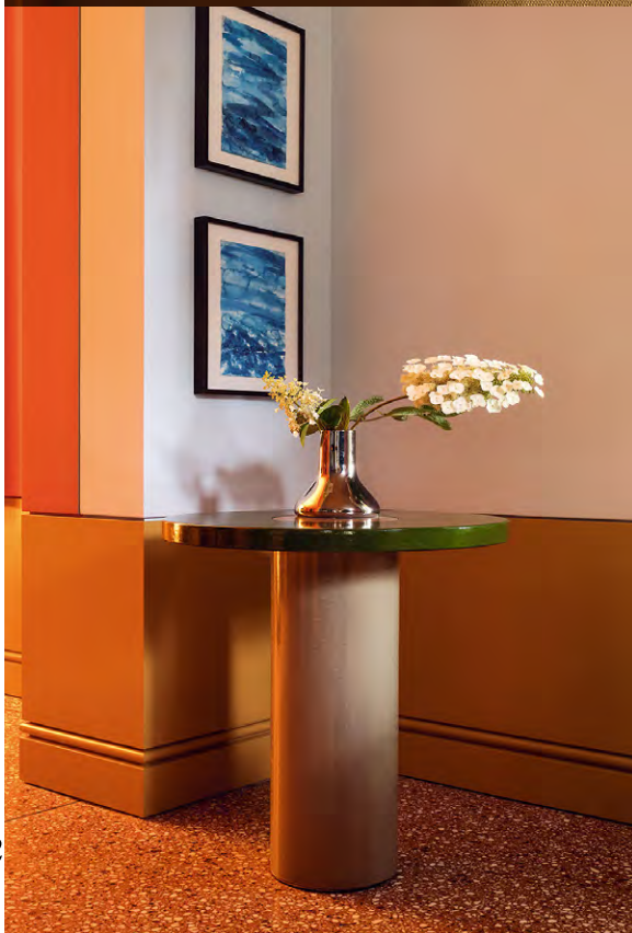
Materialität: Der Terrazzoboden mit lilafarbenen Akzenten wurde gemeinsam mit einem Spezialisten entwickelt.