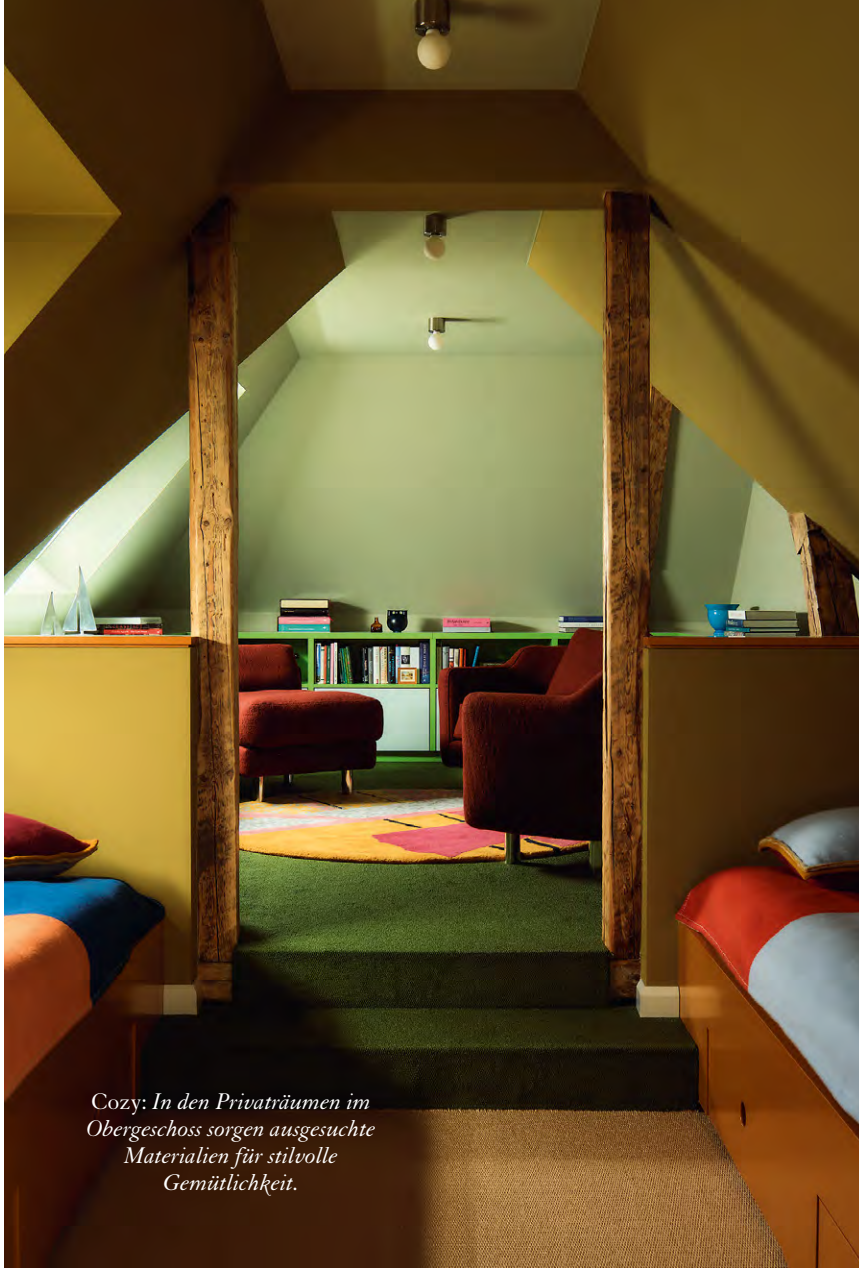
Cozy: In den Privaträumen im Obergeschoss sorgen ausgesuchte Materialien für stilvolle Gemütlichkeit.

«Wir sind immer auf der Suche nach den Besten, die Künstler:innen ihres Faches sind.» GIBSERT PÖPPLER