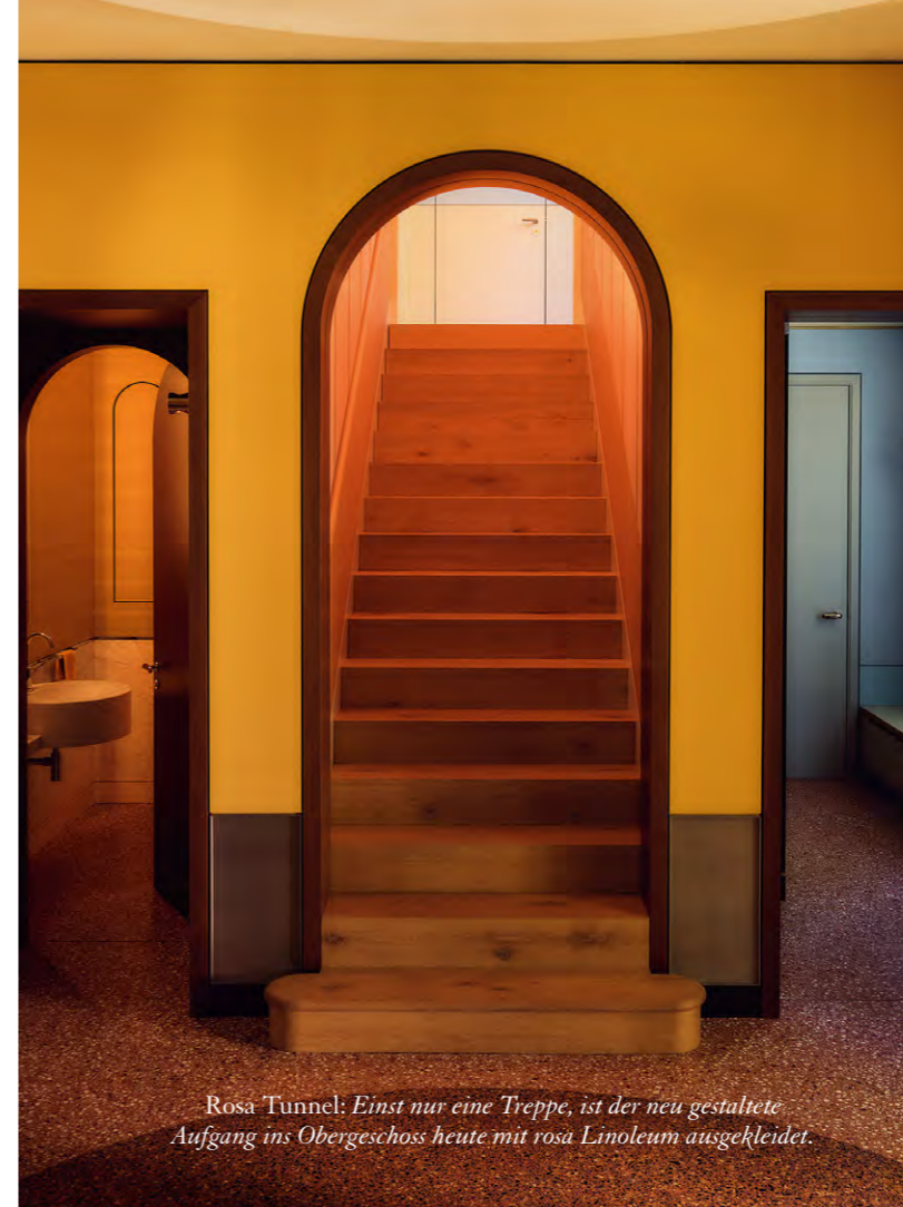
Rosa Tunnel: Einst nur eine Treppe, ist der neu gestaltete Aufgang ins Obergeschoss heute mit rosa Linoleum ausgekleidet.

Bäume blicken kann», erzählt Pöppler. Auch bei der Eingangshalle, die nun beeindruckende Sichtachsen via Wohnzimmer und Salon bis in den Garten eröffnet, wurden raumgreifende Änderungen vorgenommen: «Hier haben wir Türen und Durchgänge um fast einen Meter erhöht und mit charakteristischen Rundbögen versehen, die zu einem zentralen Motiv der Neugestaltung wurden. Das sorgt für mehr Grosszügigkeit. Besonders wird dadurch der Aufgang zum Obergeschoss, der an ein Triptychon erinnert. Durch den Tunnel wollten wir Privatheit schaffen, denn das Obergeschoss ist ein Rückzugsort für die Familie.»